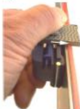
(10) für Linkshänder