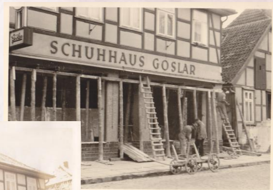
1939 kauf der Marktstr. 38 und Umbau zum Schuhgeschäft. 1955 Modernisierung