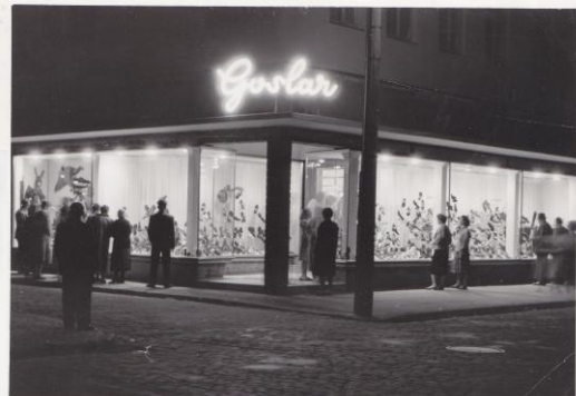
1969 Filiale Lehrte