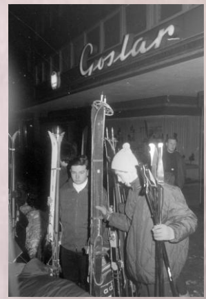
1958 1. Harzfahrt