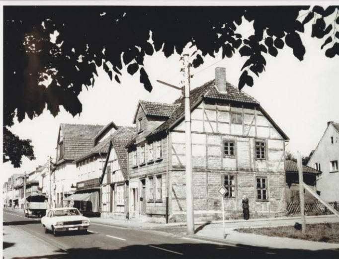
Marktstr. 38-37-36 im Jahr 1967 und 1969