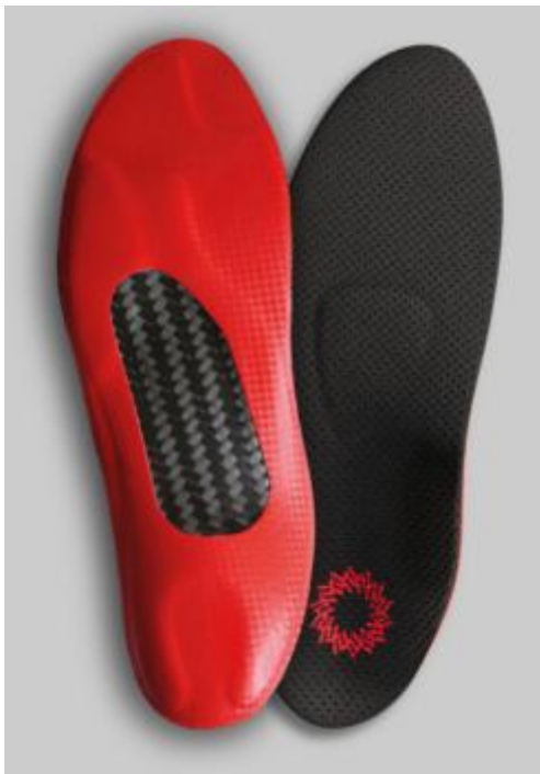
Ein Kern aus Carbon.