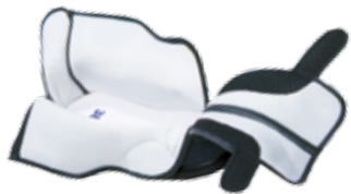
Verbandschuh mit geöffneten Verschlüssen